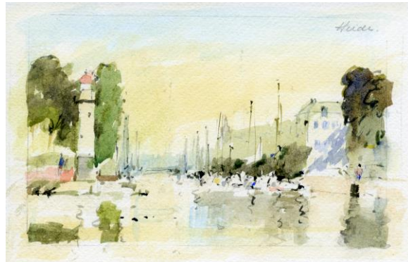
Aquarel "Haven" door F.J. vd Heide