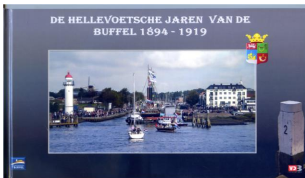
De Hellevoetsche Jaren van de Buffel

De collectie van het Stads museum is mede dankzij schenkingen ook in 2016 weer uitgebreid met een flink aantal voorwerpen, te weten foto's, boeken, ansichtkaarten en filmpjes. Het Stads museum is de schenkers – veelal (oud-) Hellevoeters – dan ook dankbaar voor deze schenkingen. Daarnaast is er een aantal voorwerpen, prenten en boeken aangekocht. Enkele bijzondere aanwinsten zijn: een "17e-Eeuws Portret van Zeeheld Abraham v.d. Hulst" (prent), een boek over het leven van "Architect Pieter Post" (1608-1669), het boek "De Hellevoetsche Jaren van de Buffel (1894–1919)" en honderden foto's van Basisschool het Schrijverke. Alle aanwinsten worden in een Excel-bestand opgenomen met daarin een omschrijving van de aanwinsten en de herkomst van de schenking of aanwinst.