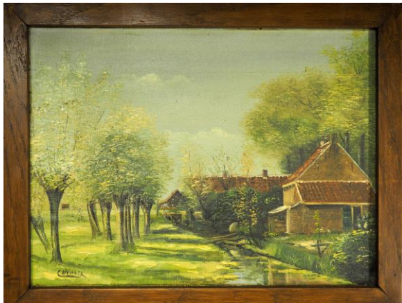
Voormalig pand Rijkstraatweg 80, Nieuwenhoorn

De collectie van het Stedsmuseum is wederom dankzij schenkingen en aankopen in 2017 weer uitgebreid met een flink aantal voorwerpen, te weten foto's, boeken, ansichtkaarten en filmpjes, Het Stedsmuseum is de schenkers – veelal (oud-) Hellevoeters – dan ook dankbaar voor deze schenkingen.