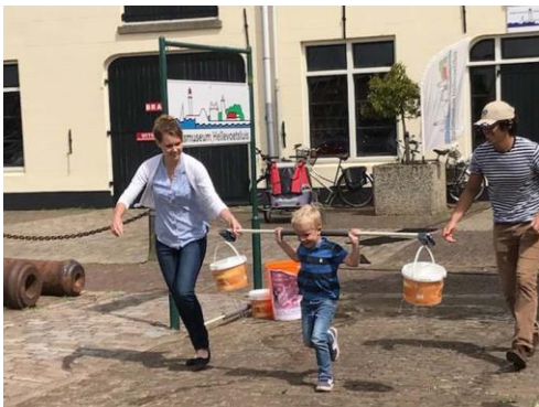
Ot en Sien: Waterjukken

Door de vrijwilligers is dit jaar een kindermiddag georganiseerd met Oud Hollandse Kinderspelletjes in de sfeer van Ot en Sien. Deze middag is goed bezocht. Poffertjes en andere Oud Hollandse lekkernijen waren te koop bij een stand voor het Museum.