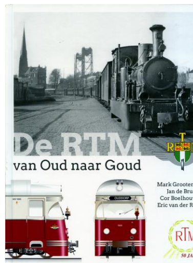
De RTM van Oud naar Goud