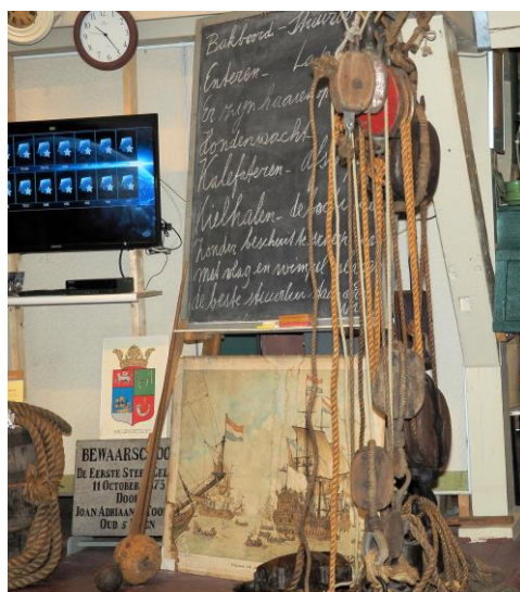
Gewichten optillen met blokken

Aan de hand van een speurtocht ontdekken de leerlingen op speelse wijze de collectie van het Stads museum, waarna aan de hand van een uitleg en een filmpje nader wordt ingegaan wat het museum verzamelt en tentoonstelt. Gedurende de maanden oktober en november bezochten 17 klassen met 410 leerlingen het museum.