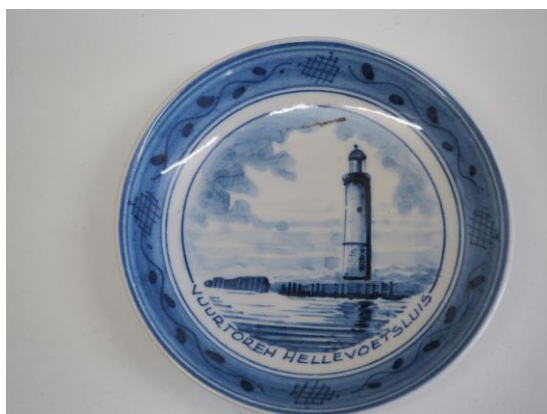
Delftsblauwe schaal afbeelding Vuurtoren