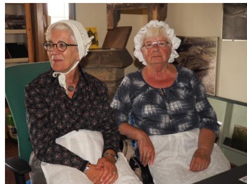
Vrijwilligsters in Ot en Sien kleding

Verder is er door de vrijwilligers in samenwerking met Verdedigingswerken, Scouting, Droogdok, De Buffel en Noord Hinder een opzet gemaakt voor een in februari 2018 te houden zgn. "Bibbergriezeltocht" voor kinderen van 4 tot 12 jaar. De voorbereidingen zijn inmiddels in volle gang. Het organiseren van deze evenementen heeft als doel heb het meer bekend maken van het museum onder het Hellevoetse publiek.